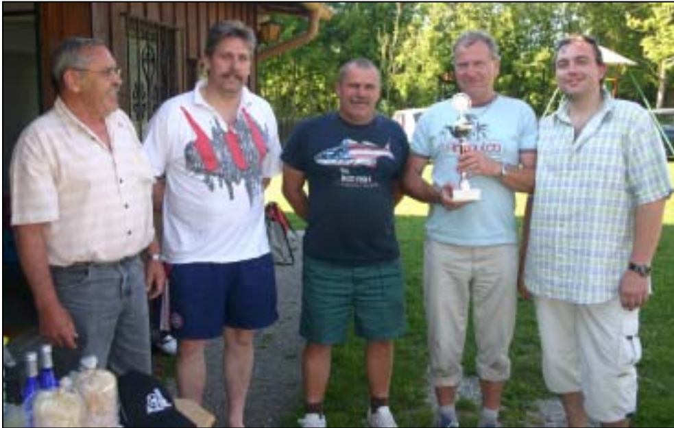
Die Sieger des Frühjahrspokals 2005 (v. l. n. r.):