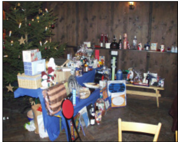
Die ansprechende Tombola