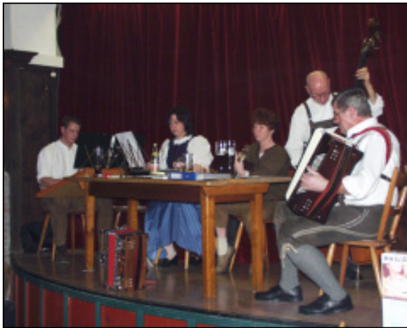
Die „Hornauer Stubnmusi“

Mit den zahlreichen Geldspenden der Mitglieder konnten schöne und wertvolle Preise zusammengestellt werden, die bei den anwesenden Mitgliedern offensichtlich auch gut angekommen sind.