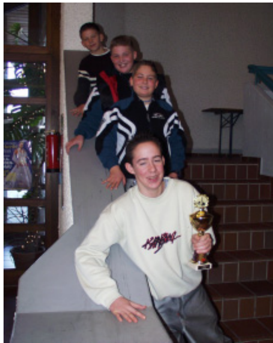
Die Jungschützen des TSV Eiselfing gewannen das Schülerturnier.