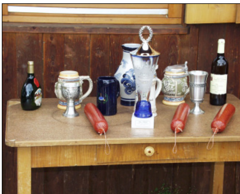
Schöne Sachpreise gab es für die Besten.